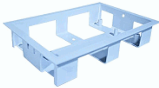
Cadre d'encastrement plafond