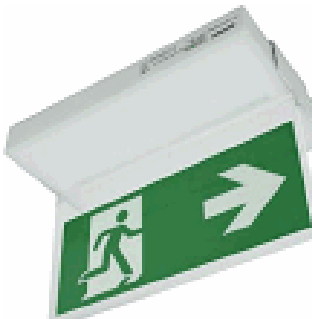
Porte étiquette TOLEDO Saillie plafond