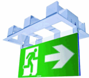
Boitier d'encastrement avec porte étiquette