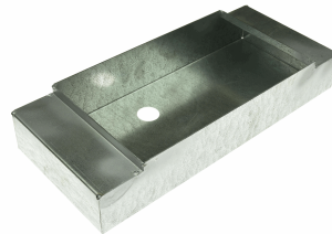
Accessoire encastrement MURAL ( Plâtre , Ciment ) Dim : 336X145X61mm